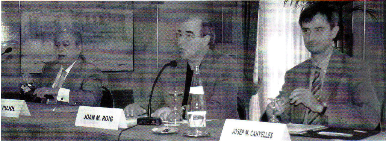
Un centenar llarg de tècnics i polítics de l'administració local així com també d'algunes organitzacions del Tercer Sector van participar a la Jornada RSA, que va ser inaugurada per Jordi Pujol i el president de l'ACM.